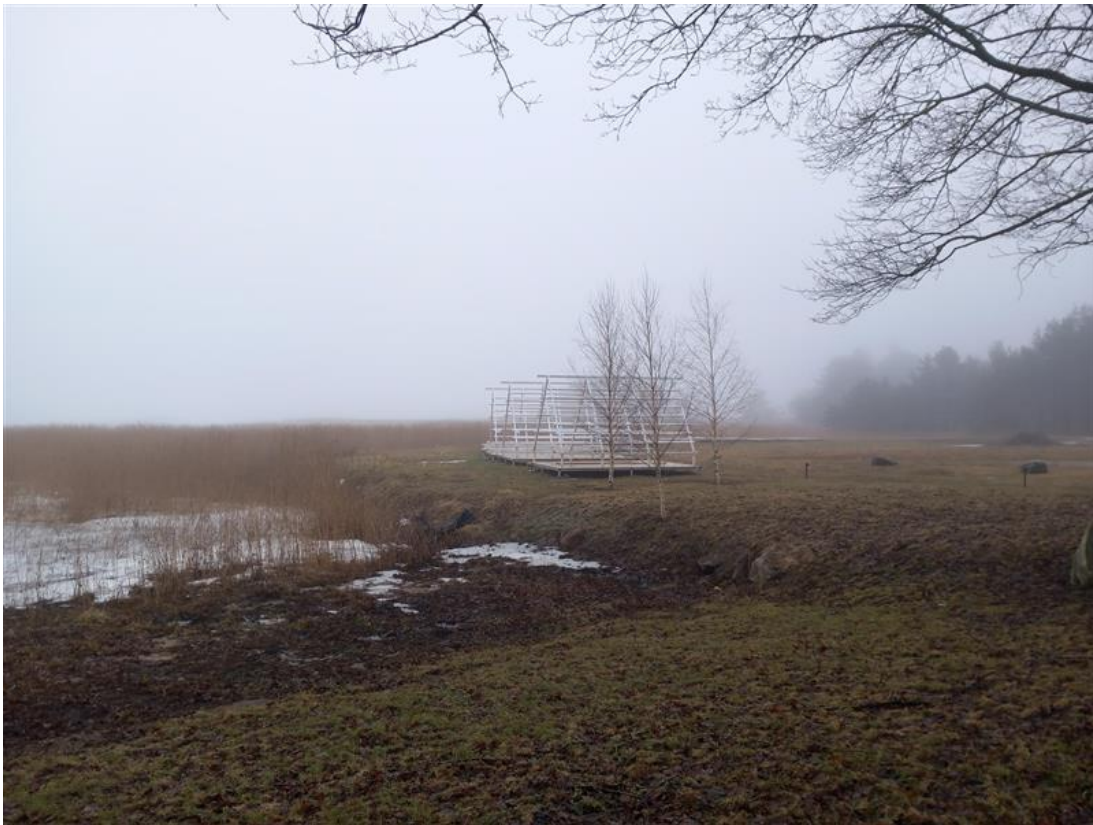
Joonis 6. Vaade planeeringualale Ranna pst 23 poolt.