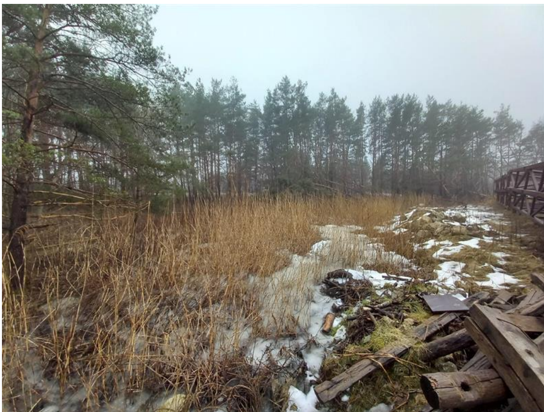
Joonis 3. Liigniiske ala mida paremalt on täidetud ning kuhu kõrvale plaanis rajada kraav.