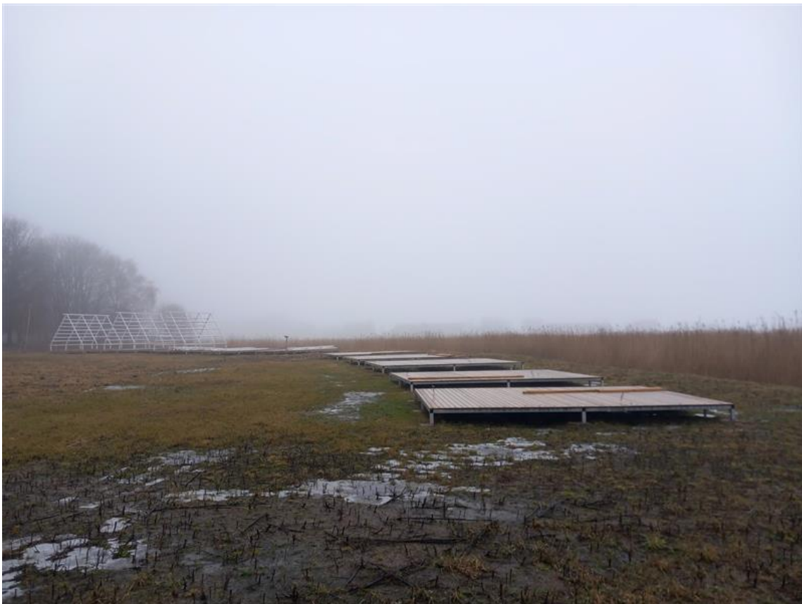
Joonis 2. Hetkel ehituskeeluvööndis olevate terrasside ala vaatega lõuna poolt.

Ranna-ala loomisel tuleb arvestada lisaks hoiuala kaitsekorrale on vaja arvestada ka ranna kaitse-eesmärke. Ranna kaitse eesmärk on rannal asuvate looduskoosluste säilitamine, inimtegevusest lähtuva kahjuliku mõju piiramine, ranna eripära arvestava asustuse suunamine ning seal vaba liikumise ja juurdepääsu tagamine (LKS § 34).