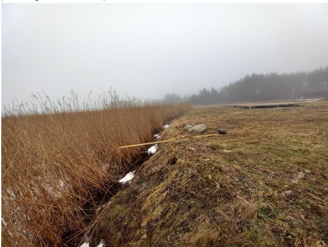
Joonis 4. Maismaa ja Väikese väina kalda nõlv vaatega lõuna poole. (, 27.02.2024)