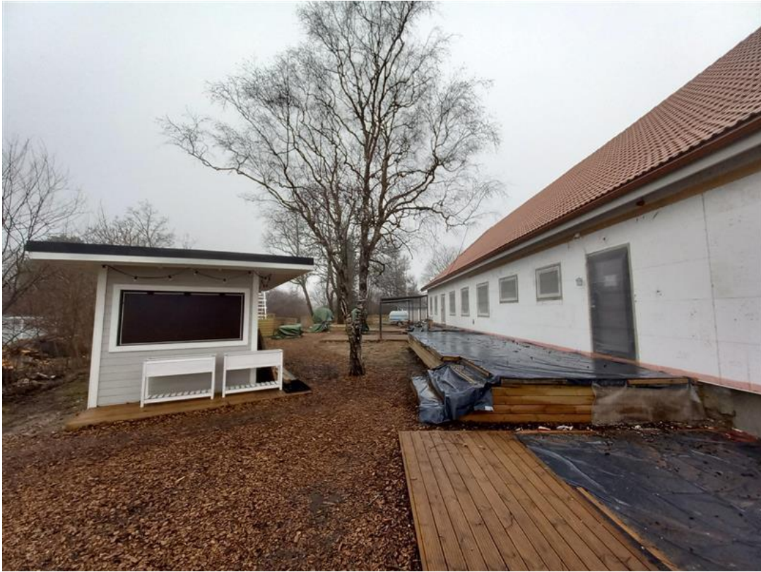
Joonis 5. Vaade Ranna pst 23 olemasolevale hoonestusele ida poolt.